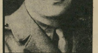
שאלתיאל „עד היום לא קיבלתי הודעה...”

אחד משני מחברי דו”ח-הביניים, יסקי: „נקודת-השקפה שלנו היתה