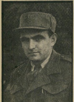
האוזנר „לשוב אם תהיינה מסקנות...”

„היה לי עוד עניין עם אחד האנשים. והוא אמר לי: אם גיבלי לא מדבר, אז אני לא מדבר, והוא המשיך ונימק זאת בכך שהסרט עשוי לעשות שירות רע למערך. אבל אנחנו לא טלוויזיה מיפלגתית, ומה עוד, שאנחנו חושבים שזה להיפך, שהסרט מעמיד את ההגנה באור נכון. היא היתה מסוגלת להודות בטעות ובמישגה.”