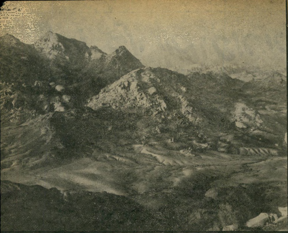
"סיני" כפי שצולם על ידי פולברג היצמדות לטבע על כל פרטיו

המרהיבה של הרי דרום-הארץ, החל מוורוד, סגול, אדום וכלה ב"חומים שונים וכחול-שמים עז, מה-וויס חומר מעולה, ממש צילום מוכן, ואין לך אלא לבחור את ה"פרים" וללחוץ!