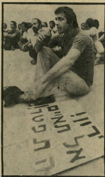
כתב גורן ייצוג בחו"ל

בראשית היה רעיון לערוך, עם תום שידורי עמוד האש, תוכנית-מלל ארוכה בצורת דיון אל תוך הלילה, בהנחיית ירון לונדון, כאשר התוכנית תכלול