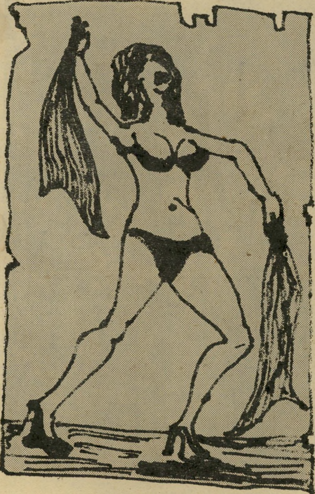
מופע סטריפטז'ו הסרת החסינות

(המשך מעמוד 4) אין זה סוד שאדולף היטלר סבל מהיסטריה (אולי לא נכון שבמהלך התקפיו הוא היה משליך עצמו על הריצפה ונושך את השטיח, אבל נכון שהוא בלע הרלי גלולות כדי שזה לא יקרה). סטאלין לקח בהסתיוידות-עורקים, שגרמה לשיגעון-הרדיפה שלו.