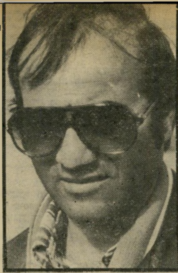
עסקן אידי מי הלשין

"בסוף כל ליגה אני נתקל בתופעה ה־זאת", אמר המאמן, "אלה הם אנשים שמוצאים כך פורקן למתחים שלהם. חוץ מזה אני לא פוחד מכל העניין".