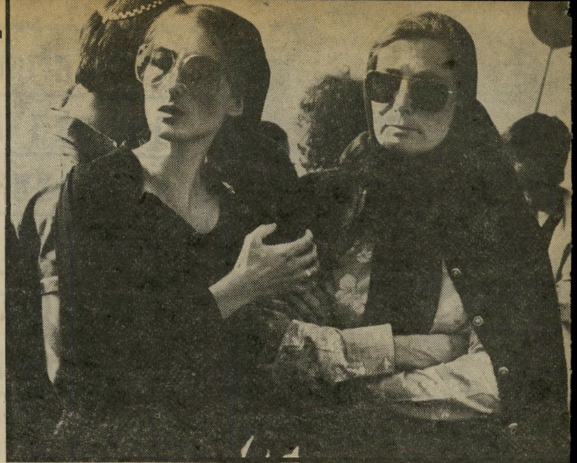
האלמנה עדינה ואחת הכנות יוכבד שמאלן ופאציפיסט הפך לאומן קיצוני

שהוא מלעיג על הנצרות. בצד פואמה זו פירסם אצ"ג פואמה אחרת - "תפוחים אדומים של עץ-הדיו", עליה חתם בשם "העט", מוסטפא זיהיב". בפואמה זו עשה אצ"ג שימוש נועז בשילוש הנוצרי הקדוש (האב, הבן ורוח-הקודש). כתב אצ"ג בין השאר: "אניח ידיים מסביב לגוף... תשכבי! כוואלט וייטמן: קבלי את הזרע שלי למען קיום העולם, אשה! יולדי ישו. אל תחששי יולדי ישו... מה זה משנה היום או מחר. היינו הך יהיה לי (אני מחייך). תינוקות שפכתי על כרסי נשים בלילות הצעירים..." בשל מישפט שהוגש