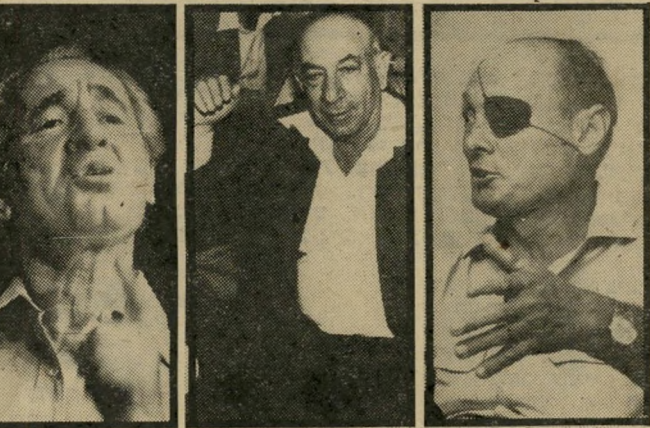
רפ"י'סט דיון רפ"י'סט הורביץ רפ"י'סט פרס כבר ניצחו