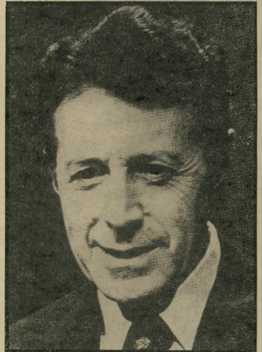
שרי-הגנה ווינברגר עסקים בסעודיה

פעולה כזו אינה סותרת כלל את הסרת האמברגו על חיטה אמריקאית לברית-המועצות, או את ניהולו של המשאומתן על הגבלות לחימוש הגרעיני. הייג לא מעלה כלל על דעתו מאבק חזיתי סובייטיים. הוא נלחם למען