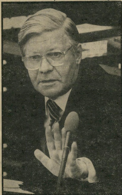
הדמוט שמורט בגין נכס אלקטוראלי

ראשה הממשלה, מנחם בגין, הוכיח השבוע שוב את סגולותיו התרומיות כמלכד לאומי כימט-מיקצועי. בנאום