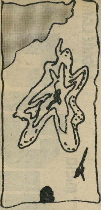
הסדין שלי כתם מרהיב

מעפולה לחיפה כשהגעתי לעפולה, נראתה לי תחנת האוטובוסים של אגד סגורה ומסוגרה באופן חשוד. עמדו כמה אנשים מחוץ לתחנה, מחכים לאוטובוס לגבעתי-המו-