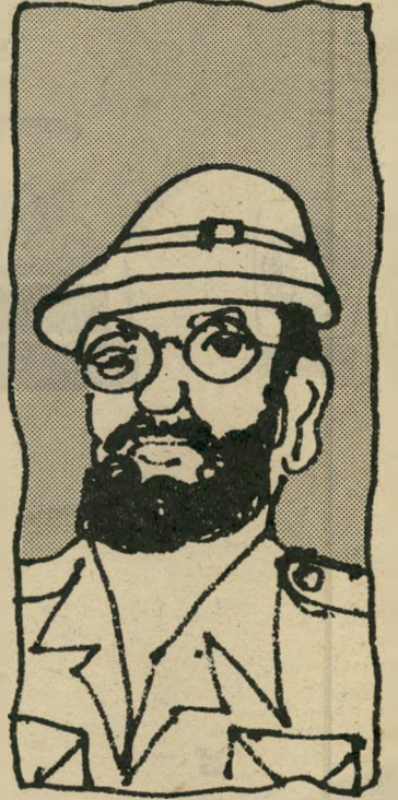
מינגבעת שעם אילון רק היתה לי

מלון זול טוב, הלכתי למלון. מישרד המלון נמצא בקומה השנייה. המלון עצמו היה מורכב מכמה חדרים בקומת הקרקע.