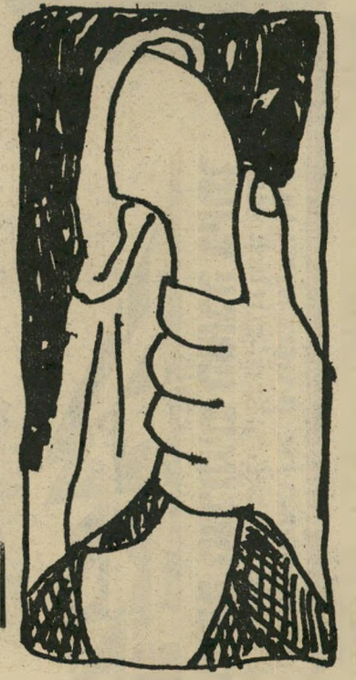
הכנות מודיעין מיוחד

המסע נפלי עלי מה שנפל עלי, ויום אחד הייתי צריך לנסוע למקום שתמיד חשבתי שהוא נמצא רק באגדות, איזה קיבוץ בין עפולה ובית-שאן. צילצלתי ל- מודיעין של אגד, ושם אמרו לי שפעמיים ביום, בבוקר ובשעה שתיים אחרי-הצהריים, יוצא אוטובוס מתל-אביב לבית-שאן, ועוצר אפילו באותו קיבוץ. ואיך חוזרים? האוטובוס האחרון מעפולה לתל-אביב יוצא בש-וחצי למנוע ערב,