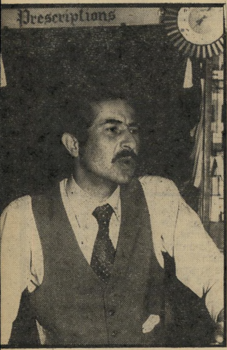
רוקח תזוין — פוגעים בבריאות

מה עושים? בהערה קטנה, מתחת לרשימת המרכיבים של התרופה הישראלית, כתוב: "מיוצר עבור א"י ב"א", סוכנות-שיווק בית-לחם". כך הפכה התרופה לכשרה. מעתה זוהי בעייתם של הרוקחים והחולים בגדה ה-מערבית, שבה לא חלים חוקי מדינת-ישראל. אפשר לרכוש את התרופה ול-השתמש בה, ואין צו של משרד-הבריאות