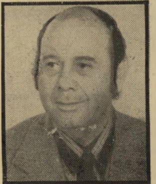
פירסומאי נחמן העיקר: לא לזוז

מוזו ישב עור וייצמן. פרס היה סבור שהוא מציע לווייצמן הצעה שאי-אפשר לסרב לה: המקום השני ב-י רשימת המערך, ותפקיד של