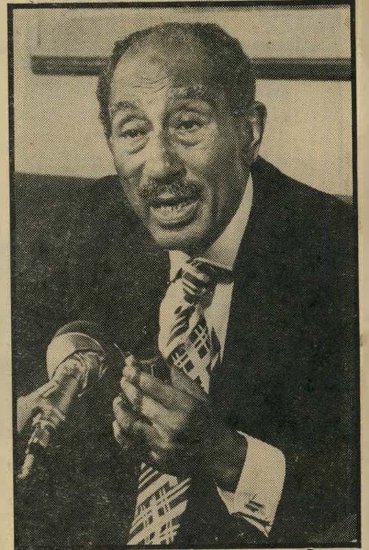
נשיא מצריים אל-סאדאת רשיון מוגבל להשתתף בלבנון

בגין כבר הצהיר, שאין סיבה לעימות עם ארצות-הברית בנושא מטוסי אייווקס לסעודיה, וזאת, תמורת יד חופשית למתנחלים בגדה ולרפול בדרום-לבנון. המצרים הבטיחו להייג בסיסים בראס באנאס, נגד דרוסיתמן, אחיפתה לוב; ובשדה-ציון, כדי להגן על