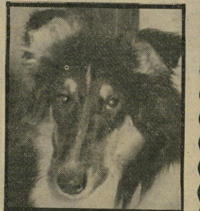
לישי פשוט נעלם

לישי (כמו „מעלישי“) בן השנה, קולי יפהפה בצבעי שחור-לבן, כלבו של הצלם תבוק לוינסון מעין-ורד, פשוט נעלם מן הבית. יבורך מי שיודיע על הימצאו לטלפון מס' (052)61405.