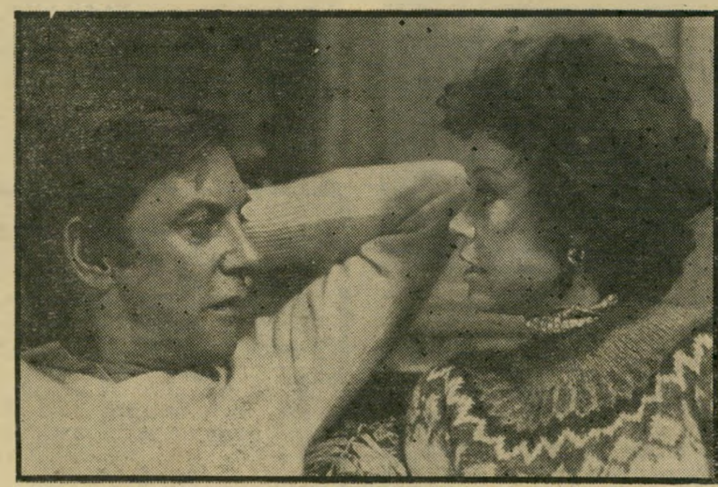
מרי טיילור מור ודונאלד סאתרלנד ב"אנשים פשוטים" הפנים האחרים של האשה המטופחת

פורד יש לומר שהצליח בכל המובנים. מבחינה טכנית זהו סרט פשוט עד כדי להרגיז, סרט שכמותו אפשר היה לעשות גם בישראל — אילו היה מצוי כאן הכיש־ רון הדרוש לכך. אמצעי-ההפקה אינם מהווים הופך, אך מה שלא ניתן למצוא כרגע בארץ הוא צוות מתאים של שה־ קנים. על מרי טיילור מור השב רדפורד מן הרגע שקנה את זכויות הספר של ג'ודית גסט, לפני חמש שנים. וזה אולי מוזר, בהתחשב בדמותה הקבועה של מור, ה־ חביבה של אמריקה, החייכנית מן הטל־ וויזיה, שהפכה את החינניות לתעשייה משגשגת. "רציתי להראות את הפן האחר שלה", טען רדפורד כאשר הציע להפקיד בידיה את תפקיד האשה היפה, המטרי־ פחת, המעודנת, המאלצת את עצמה להת־ נכר לכל מה שעשוי לפגום בדימוי שהיא קבעה לעצמה. מור לראות על המסך את שיחת החר־ שים בין האם ובנה הצעיר ("אלה אנשים אומרים א ל ולא עם אנשים אחרים", אומר רדפורד) שהרי שבועיים לפני שיצא הסרט אל המסכים התאבדה בנה בן ה־23 של מרי טיילור מור, כמה חודשים אחרי שסיפרה בעיתונים על יחסיהם הקרובים.