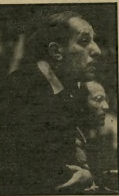
מאמן קליין מסתין להחלטה

דוית-הכדורגל, והומלץ לאסור כל מגע כגון זה, עד גמר מישחקיה-הליגה.