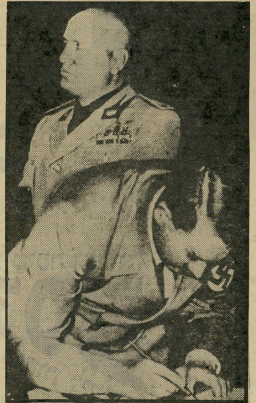
פאשיסט בניטו מוסוליני עם היטלר במינכן נושא לחיקוי

של פגישה פוליטית חוקית. התשעה היו חברי המפלגה העממית הדמוקרטית, שזכתה בבחירות החופשיות האחרונות שנערכו בבוליביה, לפני פחות משנה. מאז ההפיכה הצבאית הפאשיסטית סיכנו מנהיגי המפלגה את חייהם, מתחו ביקורת גלויה על המישטר, ניסו לעורר את דעת הקהל העולמית נגד מדיניות הרדיפות והעינויים של מאזה. תשעת המנהיגים נפגשו בבית פרטי כדי לדון בתוכנית הצנע החדשה של הממשלה. הצנע התבטא בחיי סול סובסידיות למוצרי-סוד ולדלק-חימום לזקנים ולנוקעים. בכך גזר המישטר הידרדרות נוספת ברמת-החיים הירודה בלאו הכי של שכבות המצוקה בבוליביה. רצח ועינויים. הפגישה נפסקה על-ידי הסתערות מתוכננת של כוחות הביטחון והמישטרה. כל תשעת המנהיגים אינו קשות לפני שנרצחו. הנשיא אינו טורח להכחיש את הרצח. הוא טוען שהנרצחים היו "טרוריסטים פוטנציאליים (!) עם כוונות קרימינאליות".