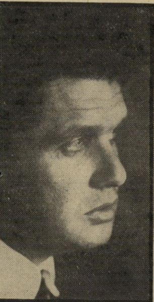
פרקליט מישגב לסגור את הדלתיים

הסניגור, התובע והשופט חיטטו בספרים. איש מהם לא מצא את החוק החדש. השופט שלח את ה"מתחה לספריית בית-המישפט