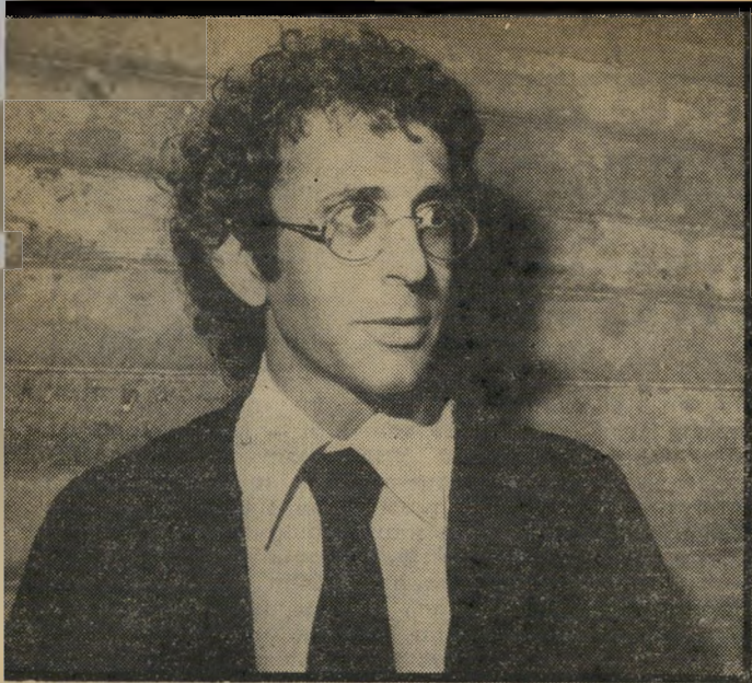
פרקליט שוהם קדימה, לבג"ץ

גדול, משתמשים בו לעתים קרובות מאוד במישפטים פליליים. אבל הסניגור החרוץ בדק את תיקו קון החוק בכל שלבי חקירתו כדי כנסת, וגילה כי הסעיף הזה הוסף להצעת החוק המקורית רק אחרי שעברה כבר את הקריאה הראשונה.