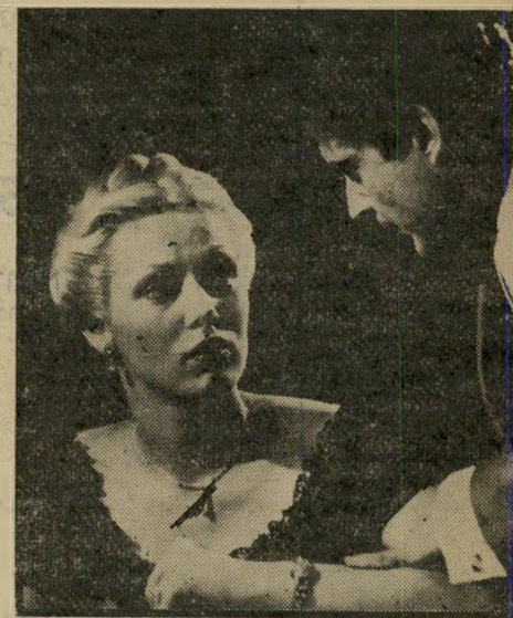
דה-נירו וקתי מוריאטי פצצה טעונה

שנים, והופך אותו לכרוניקה קפדנית של חיי אדם, שאין לו שום דרך אחרת לבטא את עצמו, חוץ מן האלימות. הזירה, כך נדמה, היא עבורו המקום שבו הוא מרגיש חופשי ביותר, ולו רק משום שמה-לומת אגרוף שם היא לא רק חוקית, אלא אפילו מומלצת, ואין שום צורך בשליטה עצמית, ואכן, סקורסזה מדגיש את ההתפרקות המוחלטת של לה-מוטה בזירה, את הפתיחות המוחלטת שבה הוא מחלק מהלומות ומקבל מהלומות, ונדמה כאילו הוא נהנה משני הדברים כאותה המידה. סקורסזה עוקב אחרי לה-מוטה מאז ש- היה בן 19, בחדר מעופש בברונקס, עד לזכותו בתואר העולמי, ההצלחה, הווי-לוג, ומכונות הפאר, וממשיך לרדוף אותו אחרי פרישתו — כשהוא כבר בעל מיסבאה כרסתן בפלורידה, מספר בדיחות