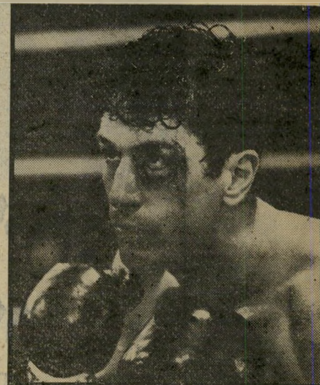
רוברט דה-נירו ב"שור הזועם" מתגרף הייתי