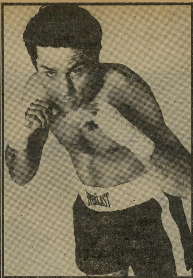
המתגרף ג'ק לה-מוטה בנעוריו