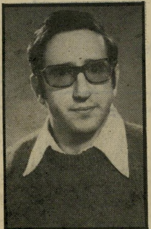
קורא סובול "האדון חזקן"

המודקן כועס על שליט לוב - כנראה משום שמנע בכוח חדירתן של "בריגדות אדומות" לשטחה של לוב. נכבדי ירושלים מחאו