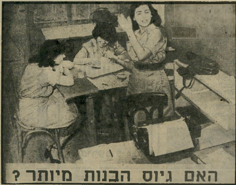
האם גיוס הבנות מיותר?

אך המהפכה הסינגולרית — חשובה ככל שהיתה — לא היתה העיקר. המהפכה האמיתית שלנו היתה במישור אחר, וגם בה נחלנו ניצחון ניכר — אך עדיין לא מכרע. מהפכה זו נוגעת לעצם קיומה של העיתונות בחברה המודרנית. זו מול זו עומדות כאן שתי תפיסות. שאין ביניהן גשר. התפיסה האחת, שאפשר לכנותה "הרוי-סית", אומרת: על העיתונות לפרסם רק חומר מועיל. תפקידה לחנך. היא צריכה לפעול לחל, לתפת הכלל (משמע, למעשה: לטובת המימד, או השליטון). התפיסה השנייה, שאפשר לכנותה "האנג-וריסאכסית", אומרת: על העיתונות לפרסם את הכל, אלא אם הוכח שיש בכך נזק מיוחד וחריג. כל העיתונות הישראלית דגלה, בי