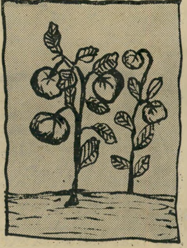
עגבניות לא רק באיסמעליה דרום

אבל מה שבייחוד ספרנו, זה היה הי-ימים שנשארו לנו עד השיחרור, אחרי שנתיים וחצי בצבא. הרבה זמן לא נשאר לנו כבר, וכל אחד חלם חלומות על מה שיעשה אחרי השיחרור. בהזדמנות זאת אני רוצה להכחיש סיפור שהתהלך