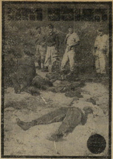
"העולם הזה" 966 תאריך: 19.4.1966

כתבו המשיטט של "העולם הזה" כאירוע, עמוס קינן, תיאר, תחת הכותרת "מי חזק מאדולף?", את התרשמותו מהתנועה הפוליטית החדשה של סרבני המס בצרפת, הפוזיאריסטים. בשער הגיליון: פיראיון הרוגים כנבול רצועת עזה.