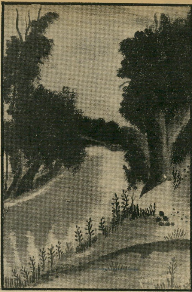
טבע במדוא הדרו של ניצה סימון קדמון ירושלם מאבא

זכתה בפרס ראשון בביאנלה ש- התקיימה בטאורין.