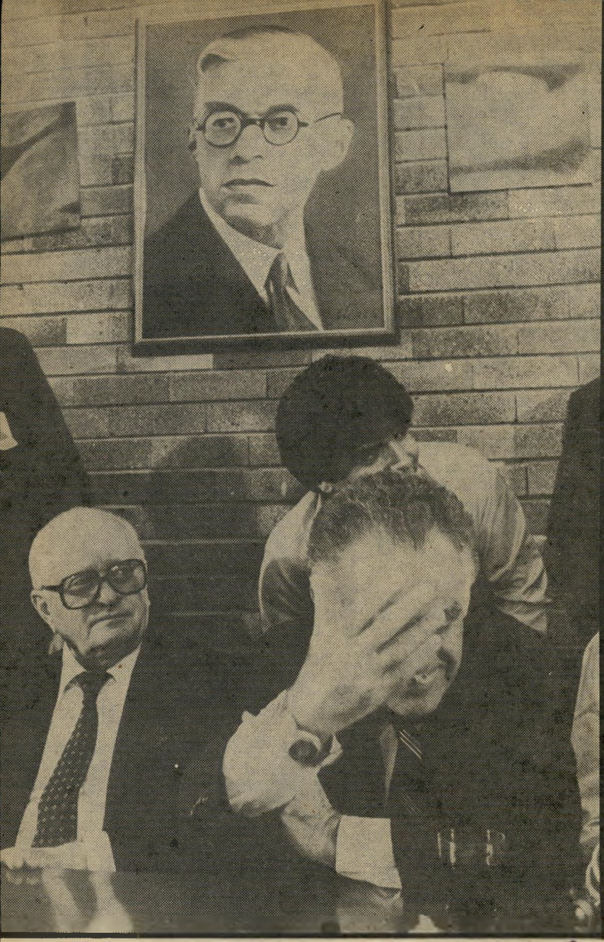
שמיר וארליך אחרי השמפניה במטה הליכוד „ניצחון אדיר“

חלק קטן נוסף מקולות ד"ש הגיע אל הליברלים העצמאיים, והוסיף להם כמחצית האחוז. יחד עם שינוי ניהול רפ"י את מערכת הבחירות הבזבזנית ביותר, וככל הנראה סתמו הבחירות בהסתדרות את הגולל על שאיפות הפוליטיות העצמאיות של ח"כ ייגאל הורביץ. בפעם הראשונה מזה 16 שנים הופיעה רפ"י בבחירות, וסוף־סוף יכול הציבור להיווכח בכוחה האמיתי. של"י הגבירה את כוחה והוכיחה, ארי לוי, שהתגברה על פרישתם של סעדיה מרציאנו ויאיר צבן. האיתור הדמוקרטי, עוד שריד מגוון של ד"ש, נמצא בחברתן הטובה של כמה רשימות עדתיות, הרבה מתחת לאחוז החסימה. ספק אם אלה האחרונים ינסו ללמוד את לקח הבחירות להסתדרות. קבלת הקצבת הבחירות לכנסת תלויה בכך שאנשים כח"כ מרדכי אלגרבלי וח"כ סעדיה מרציאנו יעמדו בראש רשימות משלהם לכנסת, וספק אם הללו יוותרו על ההקצבה השמנה, שאין שום חובה להור יציא אותה לצרכים פוליטיים דווקא. ספק אם יסיקו המפלגות הגדולות מס קנות מתוצאות הבחירות. גם הליכוד וגם המערך יראו בתוצאות הללו אישור ליציאת דרכם עד עתה. וכי לא ניצחו? הליכוד יבנה את תעמולת הבחירות שלו לכנסת על סיסמה קלה וקליטה, שאינה אומרת דבר וחצי־דבר; על אישיותו של בנגין, שעדיין יש לה קסם בקהל המצביעים המסורתי של חירות, ובעיקר על כלי כלת הבחירות של השר יורם ארידור. המערך ימשיך להאמין שאינו צריך לעשות הרבה, ושעליו רק להמשיך ולהור כיר לציבור עד כמה עליו להיות מאוכזב מן הליכוד, בלי להזכיר יותר מדי את ימיה האחרונים של ממשלת רבין. „הכוורת“ תתייצב מול „כוח 1“, ואף לא אחד מהשניים ידבר על הבעיות הדינמיות של החברה הישראלית ומדינת ישראל.