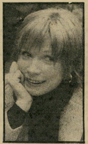
מקליון: חיים במורפים יום שישי, שעה 10.15

רת של הברון שלמה ניצן. בהפקת אהרון גולדפינגר. ● סרט קולנוע: אזו חיים במורפים (10.15) — שידור בצבע, מדבר אני-גלית) — קומדיה אמריקאית. סיפורה של אלמנה עשירה מ-