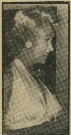
מונרו: הטא על סף ביותך שבת, שעה 10.00

● בידור: זה הסוד שלי (8.03) — מדבר עברי-רית, שחור-לבן).