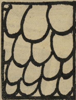
ביצים, ביצים מצב המדינה

גם ממצב הביצים אפשר ללמוד על מצב המדינה.