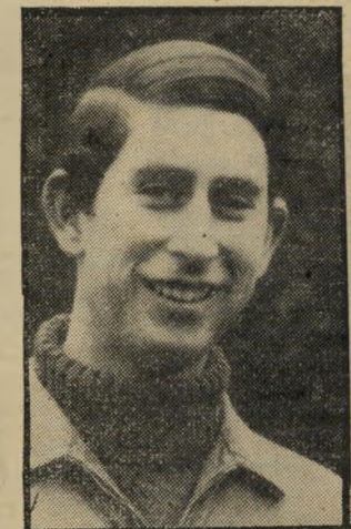
הנספח צ'ארינס חייב תודה

החקלאות בארץ סובלת מכך שהשווק קטן, ומדבר נוסף ובעל משמעות: שהייצור מתחלק בין גורמיים רבים מדי. והראיה: לפני כמה חודשים התבשרנו על עודף ניכר של ביצים (למען הדיוק: