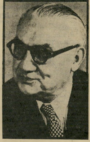
שר-חוק בוויין — דמעות במחנה-עקורים

אף אלמלא היה במחנות ציוני אחד מן החוק, אלמלא היה שם