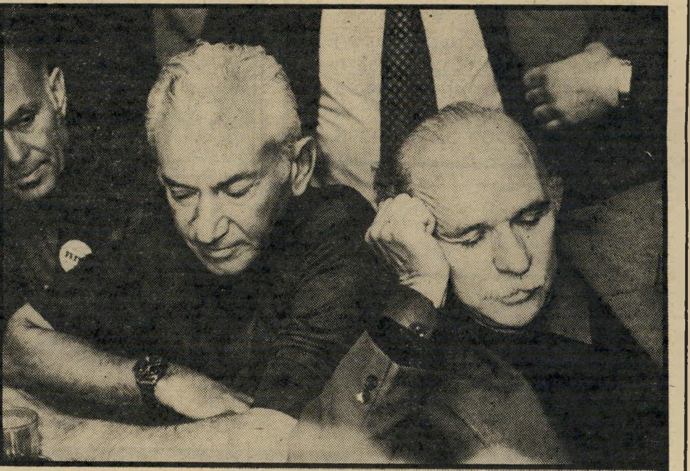
נראה מנמנם ליד ח"כ חיים בר-לב, בליל ספירת הקולות אחרי הבחירות בהסתדרות בית מופלגת-העבודה ברחוב הירקון. אך השניים אינם ישנים. הם השמילו את מבטם בגלל זרקורי הטלוויזיה, אשר האירו על פניהם ללא הרף. למטה גם עמד מכשיר טלוויזיה קטנטן, שש-טוב הירבה לצפות בו.

העבודה כיבוד עשיר כל-יך עבור עיתונאים. סוף-סוף מכ' בדת המיפלגה את אנשיההתק-שורת!"