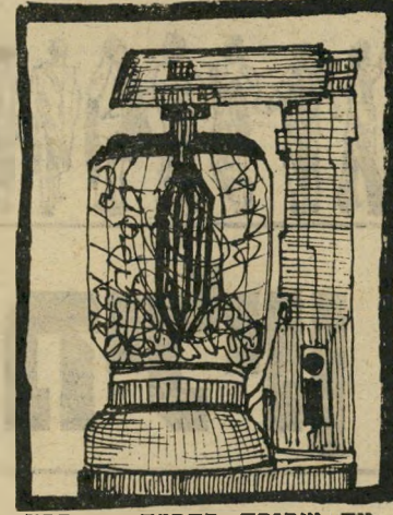
מה שקורה בהפלה — ככה אומרים המתעניינים

השדרנית החמודה אמרה שתהיה תוכנית על הפלות, ובאמת, ראיתי אולי פן וארבעה אנשים ישבו בו. דיון על הפלות, חשבת, נו, אז בטח הגברת המכובדת שיושבת משמאל היא פסי-כולוגית, הגברת שלידה היא המנחה, הצעירה המתוקה, השלישית משמאל, היא עובדת סוציאלית, והאדון עם הזקן הקטן, מימין, הוא רופא. ככה תמיד הולכות תוכניות על הפלות.