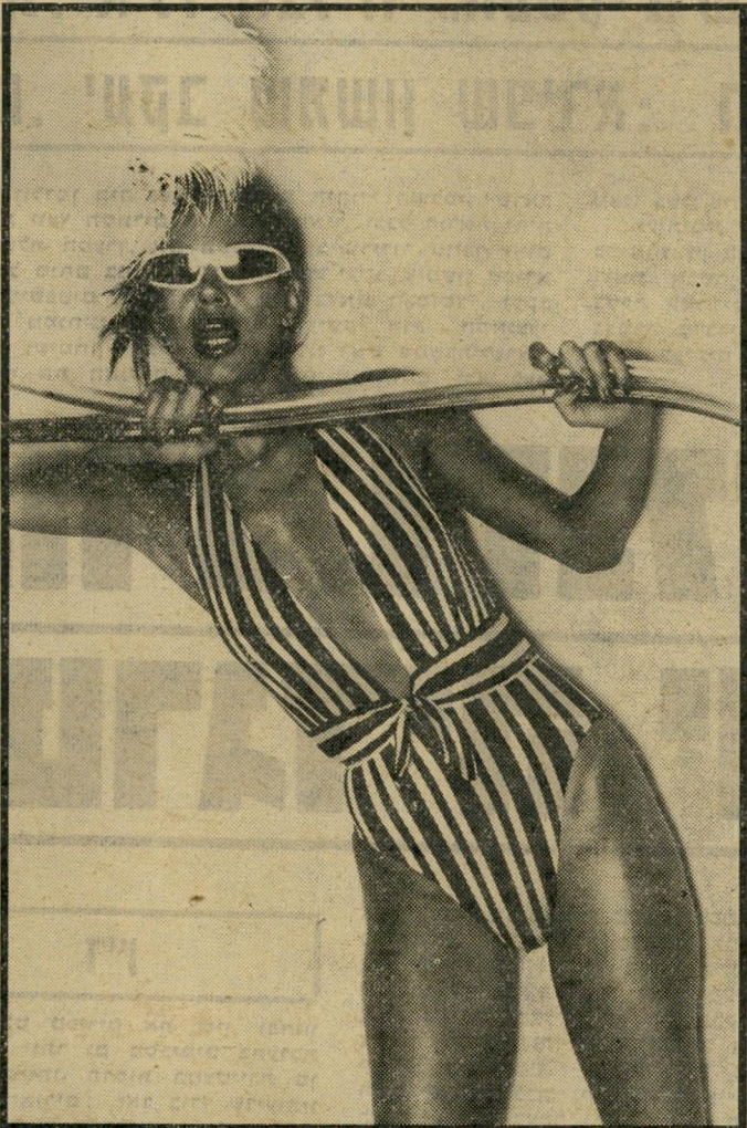
גיזרת חיתול היא הגיזרה שמספיק אובר- זון לביקיני החדש ל- קיץ 1981. בגדייהם הם נועזים יותר מבעבר.