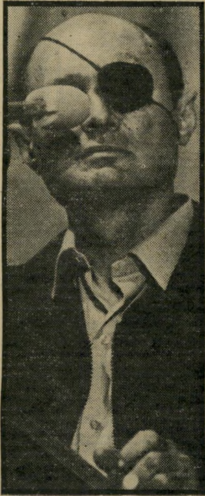
פרגמטיסט דייך חוזר לפוליטיקה

המלון עיתון, ובו מאמר שנשא את הכותרת: "משה דיין מודיע, כי הוא חוזר לפוליטיקה ומקים מיפלגה משלו."