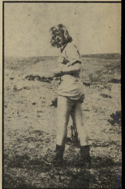
"השדה הצהובה" בחיים לא השתמשתי בקוסטימה!