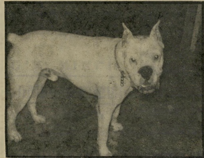
ארו מיפגש עם ידידות — בחושך

להגברת ההתנחלות ב"איוורי ה" ביסחון". לפנים יכול היה המערך לטעון שאין ברירה. סאדאת ביתק את מעגל הקסמים. דבריו של גור, שלא זכו לגינוי, והמוטו שהביא עימו כנדוניה מיפגת-העבודה, מבשרים כיצד ינהג המערך בשיל-טון, אם זה יפול לידיו בקרוב. כפל הלשון גור הוא נציגו הנאמן יחזיר את הישראלי אל התקופה שלפני נובמבר 77.