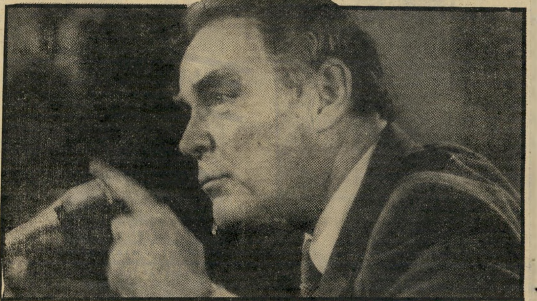
שרי-החוף אלכסנדר הייג אלן מטריד אותו

כשבוע לפני נסיון ההתנקשות פירסם ניו-סטייטסמאן כתבת שער על "רוני המזוהם", כש-אקדה ענקי בידו הימנית. גם עתה, בתוך ענני השמאלו והביצות שניקוו מדמעות-התנין, כדאי לזכור זאת.