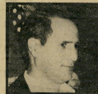
קורא ארזי לא הדליף

המערכת אינה נוהגת להחזיר כתביו וחומר הנשלח אליה. הכותבים למדור זה מתבקשים לצי"תוב בקיצור, על צד אחד של הדף, ברווחים גדולים - רצוי כמובן-כתוביה.