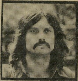
תמרידן קלינגר למה אסור?

תגובה על דברי שמרית אור נגד היורדים (העולם הזה) 2271.