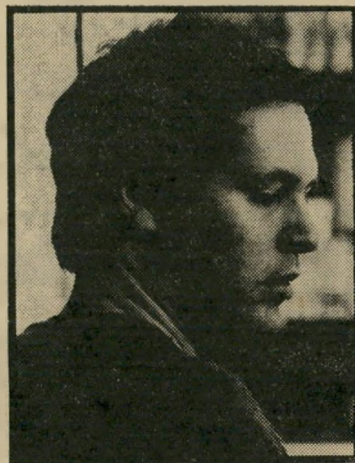
במאי עוזי פרס הקולנוע זו שפה

להתמודד עם הרשע. אבל, כמוכן, שזה עניין מישני בלבד. המעלה של סרטי דיסני ושל הקולנוע האמריקאי בכלל, היא ששאפו תמיד, בראש ובראשונה, לברר.