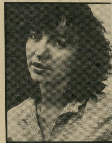
מפיקה רותי פרס אף פרטטה מאבא

אבא, שלא התלהב מעורו מעולמם ה-קולנועי של ילדיו, היתה פשוטה: "עשו מה שאתם רוצים, ובילבד שאני לא אתן פרטטה."