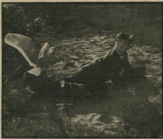
הציפור והמותקף: להפסיד את הנוצות

היצוק בונה את האימה שלו בהדרגה ובקפדנות רבה; החל ברמזים דקים בסצנות הפתיחה, בתוך חנות למימכר ציפורים, עבור בכלוב מוזהב של צמר ציפורים המועבר אל הכפר שבו עתידה להתרחש השואה, וכלן בסצנה סופית מפחידה, שבה האנשים נמלטים בהחבא אל המקום, שעה שאלפי ציפורים משקיפות עליהם בדומיה מאיימת.