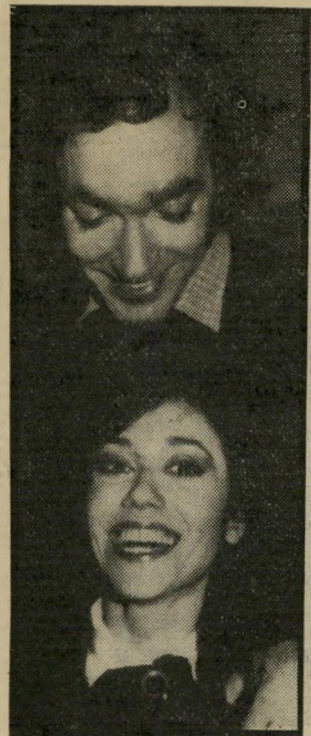
זמרת אהרון ובעל צור הכל עובר