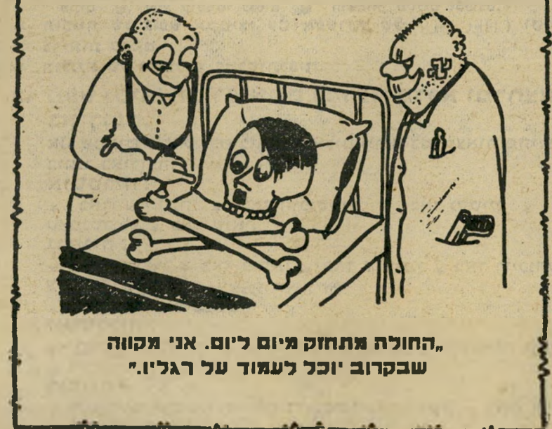
החולה מתחזק מיום ליום. אני תקווה שבקרוב יוכל לעמוד על רגליו.