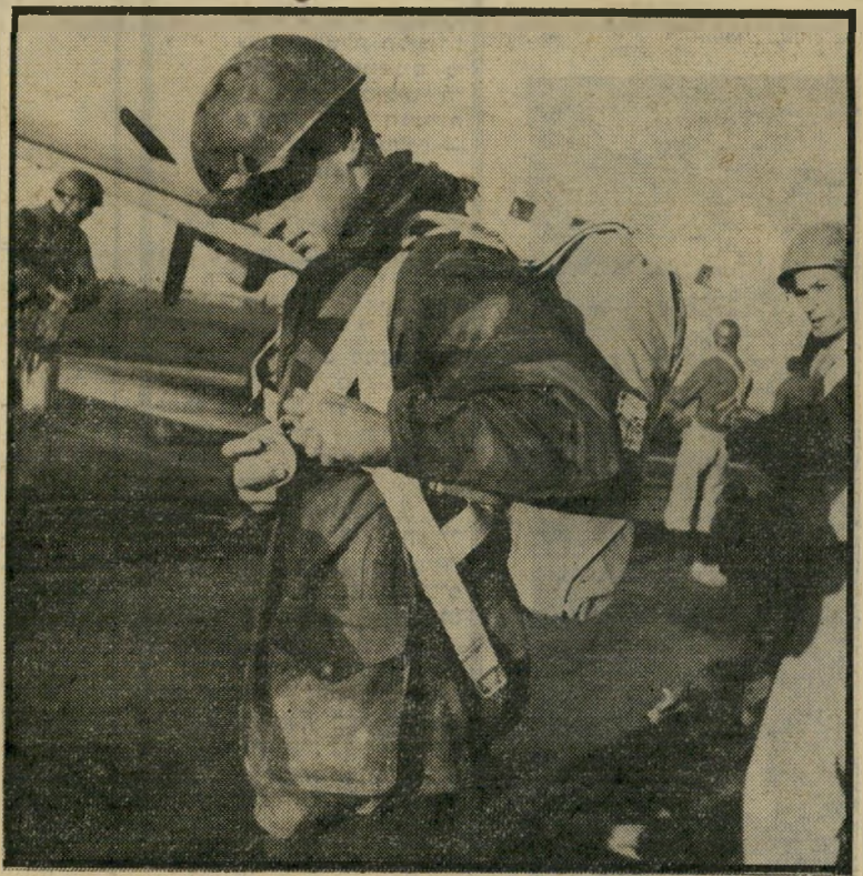
כתב לוריא מתכוון לצניחה, הם רק צצים במהדורות חדשות

כאיש השמאל וכניצול השואה במולדתו, הונגריה, מצא דוש עוד בצרפת את דרכו אל לח"י, המחתרת הלוחמת שדיברה אז בשפה שמאלנית ושביקשה למצוא מסילות