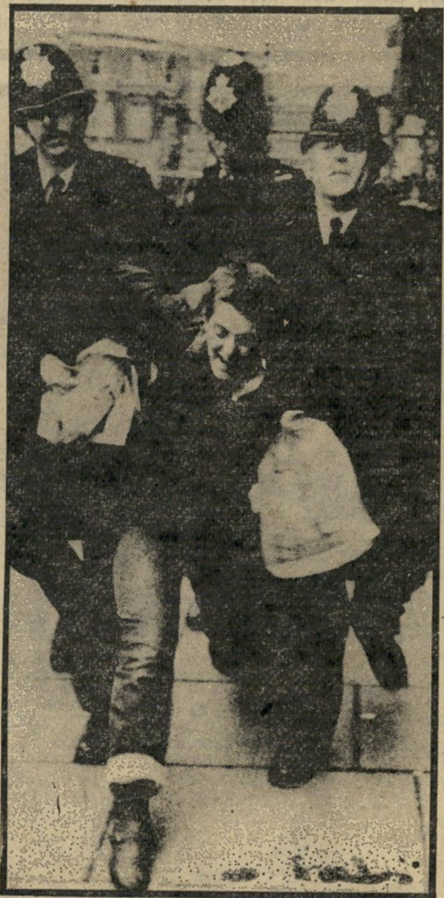
סטודנט בריטי בהפגנה אנטי-נאצית לגרש זקנים מעל גיל 70

זכות דיבור מפאשיסטים ומגזענים. "אחרי היטלר אסור לדגול במתן במה לגזענות, בתירוצים של חופש דיבור," טוענים ראשי הסתדרות הסטודנטים. בראיון טלוויזיה שבו השתתפו עשרות סטודנטים מלונדון, מנצ'סטר, ליברפול, אוכספורד וקיימברידג', צידדו כמעט כולם בשלילת זכות הדיבור מנאצים וגזענים. "תאר לך שמישהו היה מטיף להשמיד או לגרש זקנים מעל לגיל שבעים, האם היית מעלה בדעתך לתת לו פיתחון פה?" שאל אחד הסטודנטים את המראיון. "הרי הגזענים רוצים לרדף קבוצות באוכלוסיה רק מכיוון שהם יהיו דים, או שחורים."