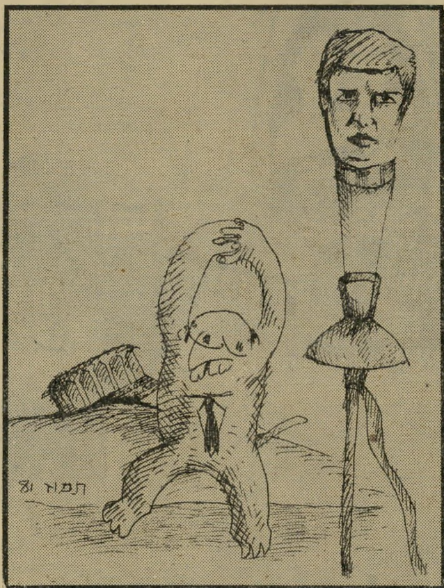
כתב אירודור ומפרפר בגין גזרים במקום גזירות