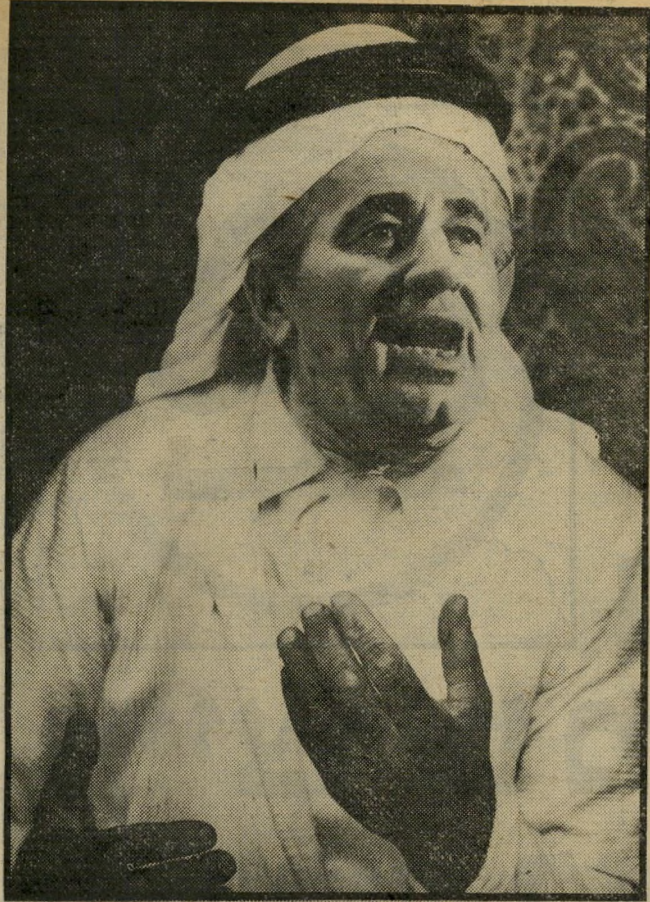
שימעון פרס גם בעקאל וכפייה שנון בפעולה