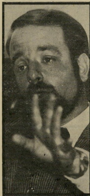
מרקיט שפטי חוקר לא מומחה

בגללה נסגר התיק, לא נמצאת כלל בתיק התביעה החדש. "על כל פנים" אומר השופט, "כאשר התיביעה מבקשת לעצור נאשם בניסבות כאלה, מחובתה לפרוש בפני בת-המישפטי את שתי חוות הדעת, ולהסביר היטב מדוע יש לסמוך על חוות הדעת האחרונה ולא על הראשונה, אשר משום-מה אינה נמצאת בתיק החקירה." מאריק אמנם שוחרר ממעצרו, אך סניגורו לא שקט. הוא פנה בתלונה ליועץ המישפטי על העלמו של מיסמר כה חשוב מתיק ה-