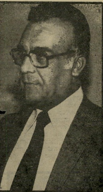
שופט האג' יחיא השמרטיפית זוכתה

אין לדעת מה גילתה מגדת-הע-תידות לבני הזוג, אבל כאשר חזרו