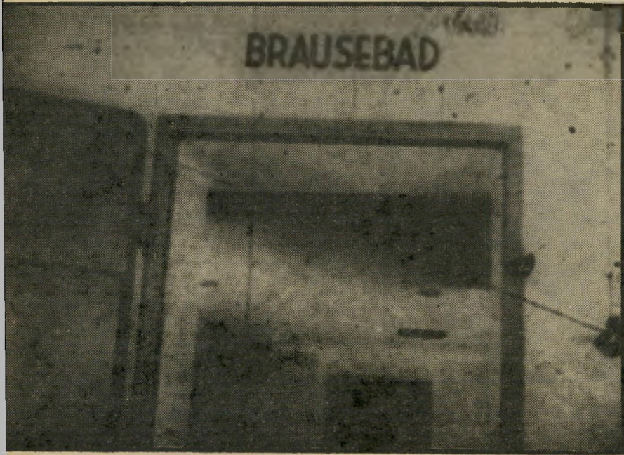
התא המשוחזר במחנה דכאו (עם הכתובת: "מיקחת") הצבע היה טרי

הפרק ה-12 של עמוד האש, שכותרתו היא "הפיתרון הסופי" (1941-1942), נפ"ח ב"מיבצע בארברוסה" (הפלישה הר גרמנית לברית-המועצות) וראשית ה"פיתרון הסופי" שהגרמנים מכינים ליהודים, בעיתוני הארץ מתפרסמות ידיעות על רצח המוני של יהודים - אבל הנהגת היישוב מסתייגת מן הידיעות. בינתיים מתקרבים חיילי הקורפוס האפריקאי של ארווין רומל לארץ-ישראל, ובריטניה ער-