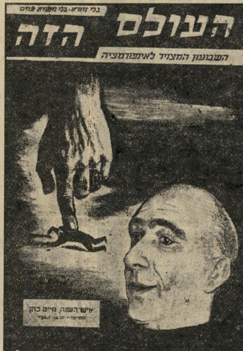
שער "העולם הזה" (812)