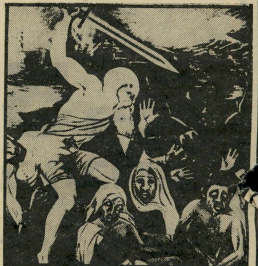
הכרזה של הפלוגות לבן נגד שחור

מטבע הדברים קיים פער בלתי מבוטל בין תדמיי-תם של אנשי הפלוגות הנוצריות הלבנוניות בישר-אל, לבין המוניטין שלהם ברחבי העולם. סעד