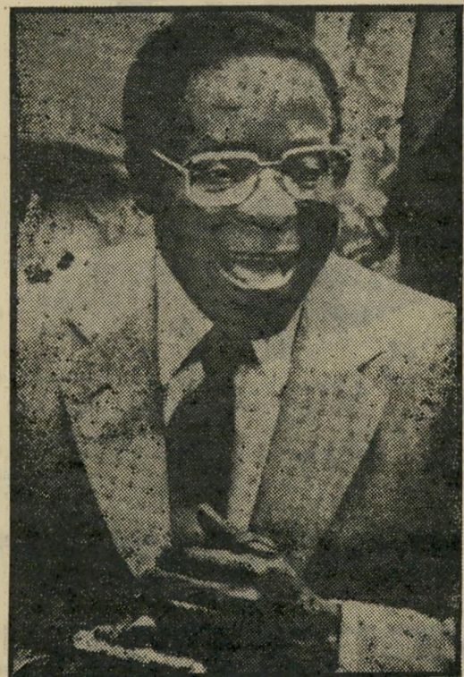
רוברט מוגבה שוק אפריקאי נגד האפרטהייד

הרעש הגדול שעורר מוגבה, וכוחות מורדים שיבטיים שהשתייכו בעבר למחתרת של ג'ושע אנקומו, היה מופרז ביותר. מוגבה מצליח להתגבר על בעיות ש-מנהיגים חלשים ממנו היו נכשלים בפיתרון. למרות הקרבות וחרף העובדה שהינקומו הורד, למעשה, בדרגה, נשאר יריבו של מוגבה בממשלה ואף דיבר לאחרונה