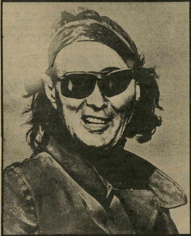
משה דיין מה שנושה השרוד...

הידיעה לקתה באי-דיוק. ביטול הזמנת הרכב לא נעשה בידי שר האוצר, יורם ארידור, אלא הנשיא הוא שהורה לבטל את ההזמנה.