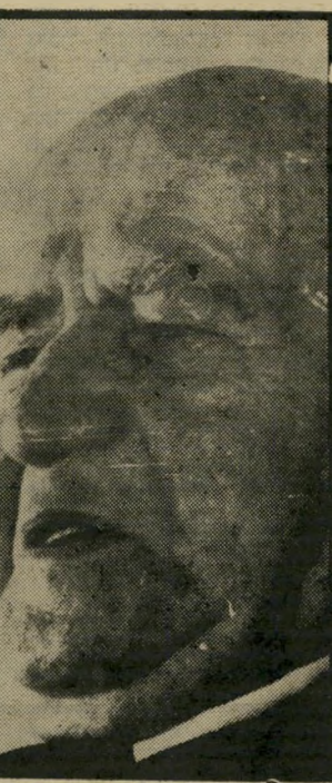
מנהיג בני-גוריון אין ציוני בגולה

החוקר היהודי-אמריקאי אליהוא ברגמן פירסם באוקטובר 1977, ב"כתביהעת המדעי Midstream, תחזית מדהימה. שנשא את השם הסחף באוכלוסייה היהודית-אמריקאית, קבע ברגמן: "כאשר תחוג ארצות-הברית ב"שנת 2076 את יובל השלוש-מאות לקיומה, ימנו יהודי ארצות-הברית, מן הסתם, לא יותר מ"944,000 נפש, ולא מן הנמנע הוא שיתמעט מיס"פרם כדי 10,420 נפש".