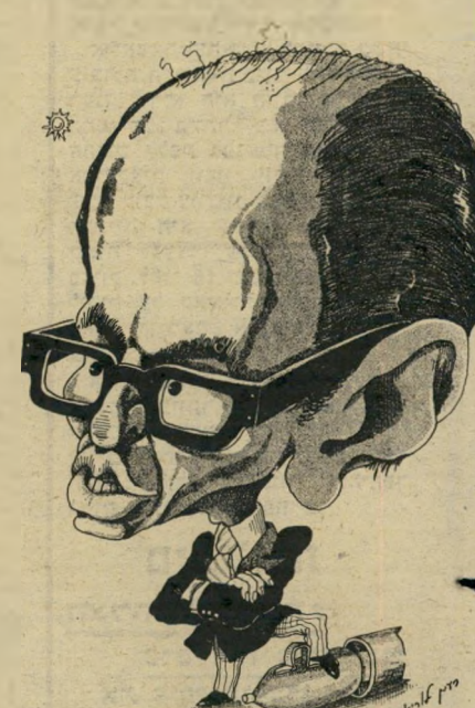
טוריסט בגין הקריקטורה שהוטרדה